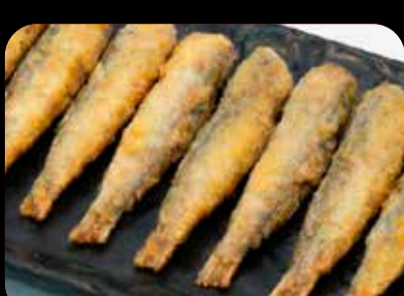
Boquerones fritos (12 unid.)