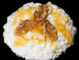
"Mel i mató" "El Pastoret" - 4,90€ Con nueces. (2,3)