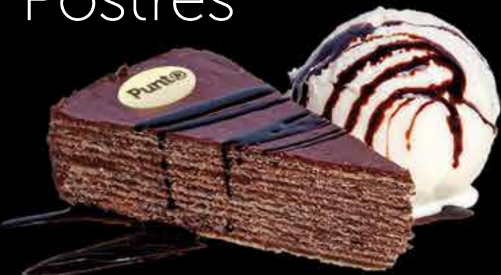
Tarta Huesito - 5,90€ Con helado de coco. (2,3,5,7,13)