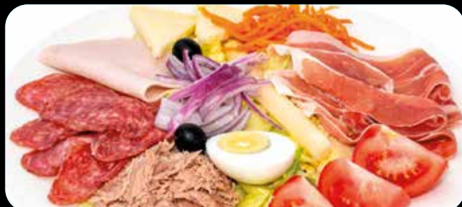
Ensalada Punt • 10,40€

Jamón serrano, fuet, queso manchego D.O., atún, huevo, pavo, lechuga, olivas negras, espárrago blanco, cebolla, zanahoria y tomate. (1,3,5,7,12)