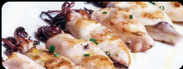
Chipirones a la plancha • 15,40€ (4,6)