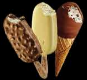
Helados Frigo Otras variedades disponibles en temporada. Consultar.