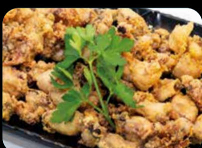
Chipirones baby a la andaluza