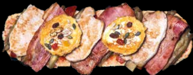
1. Terra Ferma - 14,90€ Lomo, beicon, rulo de cabra, escalivada, frutos secos y pan con tomate. (2,3,5,13)