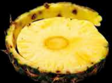
Piña natural - 2,90€