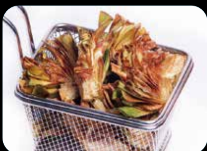
Alcachofas Punt (5)