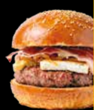
103. Deluxe - 13,90€ Hamburguesa de ternera 100%, jamón ibérico, queso brie y cebolla caramelizada. (3,5,7,8,9,13)