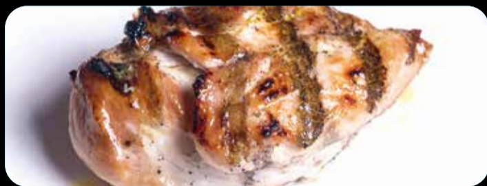
Pechuga de pollo estilo Punt ® • 12,40€ 25 minutos de cocción. Con guarnición de alubias, patatas fritas, pimientos de Padrón y pan de cristal con tomate y ajo. (3,5,12,13)