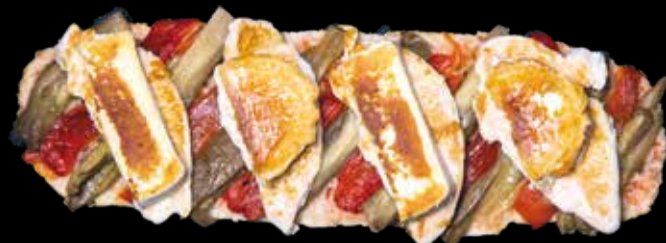
2. Pollo Campestre - 14,40€ Pechuga de pollo a la plancha (4 trozos), queso brie, rulo de cabra, escalivada y pan con tomate. (3,5,13)