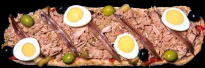
9. Clásica - 13,90€ Escalivada, atún, anchoas, olivas negras y verdes, huevo duro y pan con tomate. (1,2,3,5,6,7,12,13)