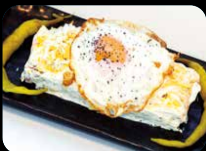
Ensaladilla Rusa Punt