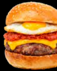
Novedad 108. Menorquina - 13,40€ Hamburguesa de ternera 100%, queso cheddar, sobrasada de Menorca, miel y huevo frito. (3,5,7,8,9,12,13)

* Hamburguesas Punt ® : no se admiten suplementos, solo quitar ingredientes sin modificar precio.