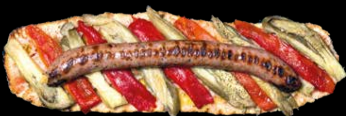
7. Long Long - 12,40€ Longaniza, escalivada y pan con tomate. (3,5,12,13)