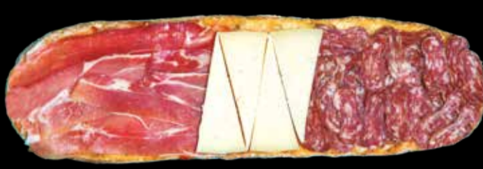
4. Merienda-cena - 12,40€ Jamón serrano, queso manchego D.O., fuet y pan con tomate. (3,5,13)