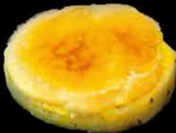
Piña con crema catalana - 5,90€ (3,5,7)