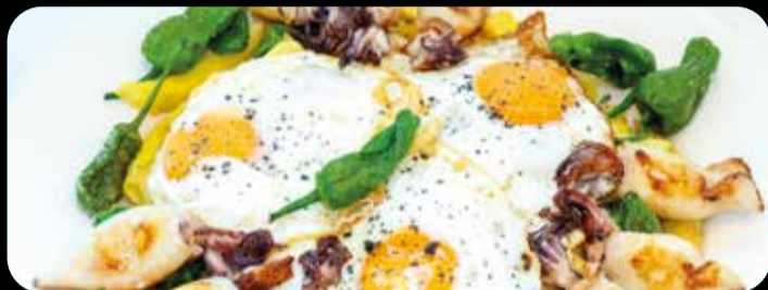
Huevos estrellados con chipirones • 18,40€ Patatas fritas, huevos fritos, chipirones a la plancha y pimientos de Padrón. (4,5,7)