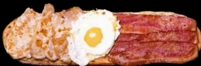
6. Porking & Egg - 12,90€ Beicon, huevo frito, lomo y pan con tomate. (3,5,7,13)