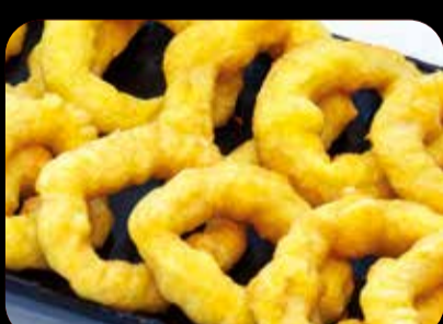
Calamares a la romana