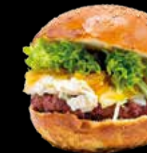
106. Rulo de cabra - 13,40€ Hamburguesa de ternera 100%, rulo de cabra, lechuga y cebolla caramelizada. (3,5,7,8,9,13)