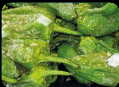
Pimientos de Padrón (5)