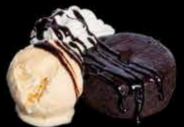
Coulant de chocolate - 5,90€ Con nata y helado de vainilla. (1,2,3,4,5,6,7,8,9,10,11,12,13,14)