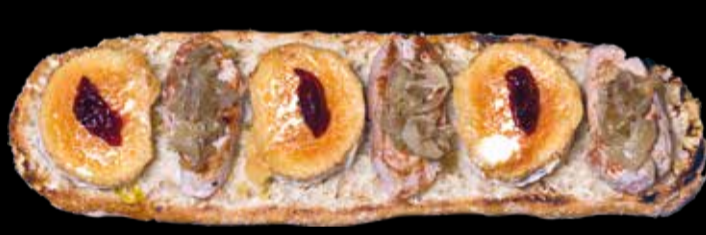
12. Ibericus - 15,40€ Solomillo de cerdo, rulo de cabra, mermelada de frutos del bosque, cebolla caramelizada y pan. (3,5,13)

* "Torrades" Punt ® : no se admiten suplementos, solo quitar ingredientes sin modificar precio.