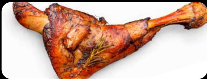
Ternasco al horno • 21,90€ Novedad Cocinado a baja temperatura. Con guarnición de patatas fritas y pimientos de Padrón. (3,5,12,13)