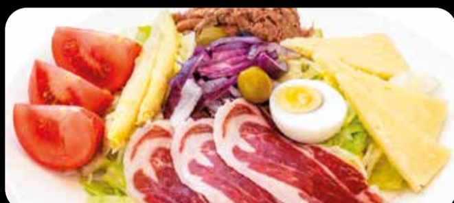
Deluxe • 11,40€

Rulo de cabra, queso brie, tomates cherry, lechuga mezcla, nueces, reducción de módena, pan y mermelada de frutos del bosque. (2,3,5)