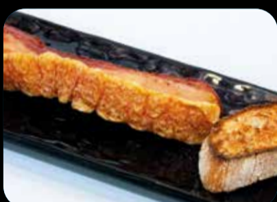
Torrezno de Soria (5)