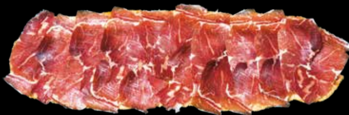
5. Peninsular - 14,90€ Auténtico jamón ibérico y pan con tomate. (3,5,13)