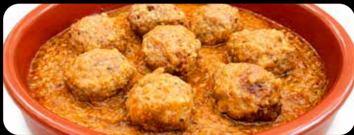
Albóndigas caseras • 7,90€ Novedad Albóndigas de carne mixta, con salsa de tomate y almendras. (2,5,12)