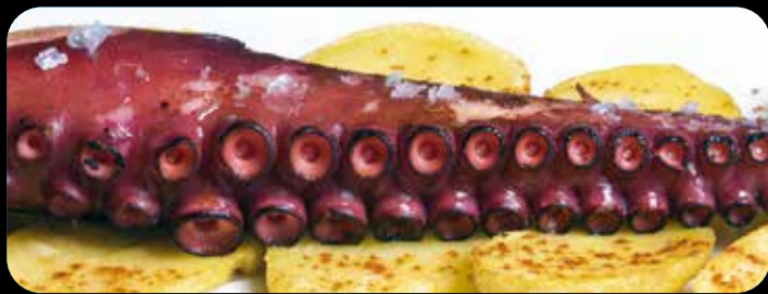
Pata de pulpo a la brasa • 22,90€ (4,6)