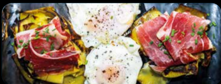
Alcachofas con jamón ibérico y huevos fritos • 13,90€ (7)