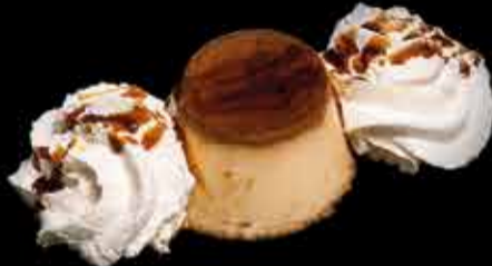
Flan casero con nata - 4,40€ (2,3,7,13)