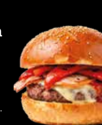
105. Louisiana - 13,40€ Hamburguesa de ternera 100%, rulo de cabra, beicon, pimiento rojo y mermelada de frutos del bosque. (3,5,7,8,9,13)