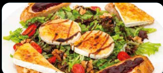
Alpina • 11,40€

Jamón serrano, fuet, queso manchego D.O., atún, huevo, pavo, lechuga, olivas negras, espárrago blanco, cebolla, zanahoria y tomate. (1,3,5,7,12)