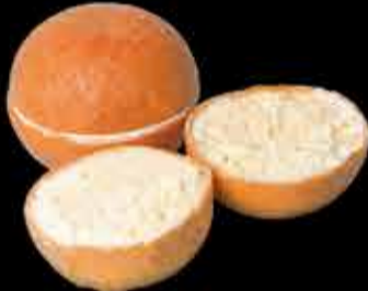
Naranja tropical - 5,50€ (2,3,5,7,13)