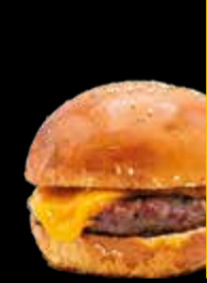
101. Beef & Cheese - 10,90€ Hamburguesa de ternera 100%, con queso. (3,5,7,8,9,13)