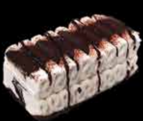
Comtessa - 4,50€ (3,5)