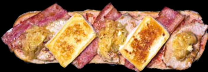
3. Delicatessen - 14,40€ Lomo, beicon, brie, cebolla caramelizada y pan con tomate. (3,5,13)