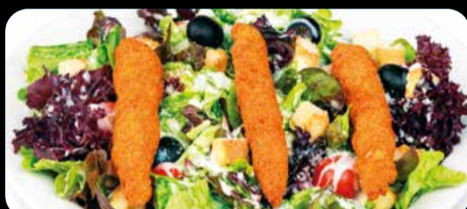
César • 10,40€

Jamón ibérico, queso manchego D.O., espárragos blancos, lechuga, atún, huevo, olivas rellenas, olivas negras, cebolla y tomate. (1,3,5,7)