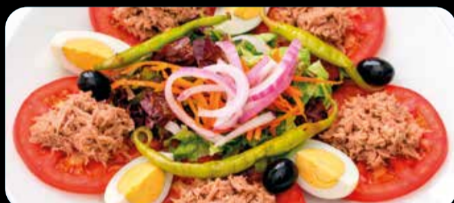
Tomate y atún • 9,90€ Novedad

Fingers de pollo, olivas negras, tomates cherry, picatostes, lechuga mezcla, queso parmesano rallado y salsa César. (1,3,5,7,8,13)