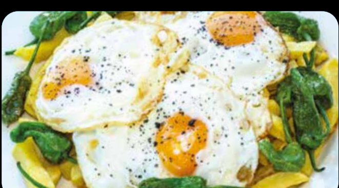
Clásicos • 9,50€ (5,7)