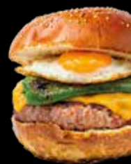
Novedad 107. Pork & roll - 11,90€ Hamburguesa de nuestra longaniza, pimiento verde, cheddar y huevo frito. (3,5,7,8,9,12,13)