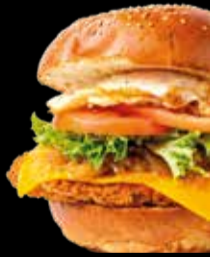
104. Big Chicken - 11,90€ Pechuga de pollo rebozada, huevo frito, lechuga, tomate, cebolla y queso. (3,5,7,8,9,10,13)