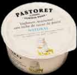
Yogur "El Pastoret" - 2,90€ (3)