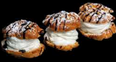
Profiteroles - 4,90€ De nata con chocolate. (3,5,7,13)