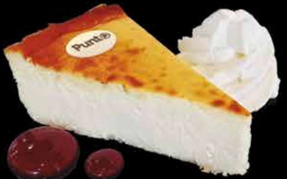
Tarta de Queso casera - 5,90€ Con nata y mermelada de frutos del bosque. (2,3,5,7,12,13)