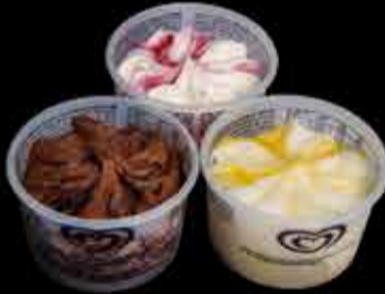
Tarrina helada - 2,90€ (3)