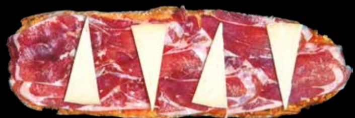
11. Dúo Ibérico - 15,40€ Jamón ibérico, queso manchego D.O. y pan con tomate. (3,5,13)