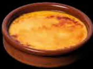
Crema Catalana - 5,40€ (3,5,7)