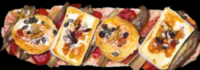
10. Vegetariana - 13,40€ Escalivada, queso brie, rulo de cabra, frutos secos y pan con tomate. (2,3,5,13)