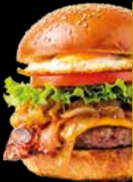
102. Beef & Cheese Completa - 12,40€ Hamburguesa de ternera 100%, beicon, huevo frito, lechuga, tomate, cebolla y queso. (3,5,7,8,9,13)