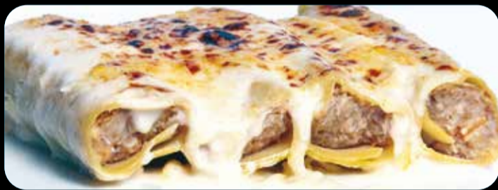
Canalones caseros • 10,90€ Canalones caseros de carne con bechamel y queso gratinado. (1,3,4,5,6,7,12,13)