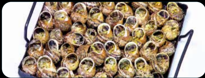
Caracoles "a la llauna" • 16,40€ (4,7,12)