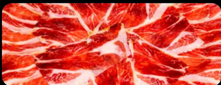
Jamón ibérico 100gr. • 18,50€ Acompañado con pan de cristal con tomate y ajo. (3,5,13)