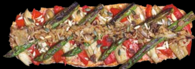
8. De la huerta - 12,40€ Escalivada, espárragos trigueros, frutos secos, cebolla caramelizada y pan con tomate. (2,3,5,13)