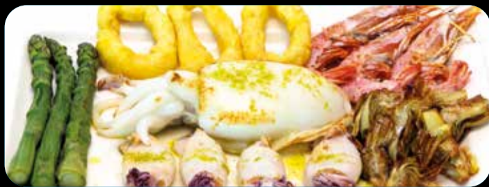
Combinado Punt ® • 22,40€ (3,4,5,6,8,11,12,13) Chipirones, calamares, gambas, sepia, espárragos trigueros y alcachofas. Acompañado de pan de cristal con tomate y ajo.