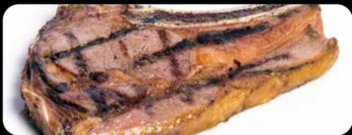
Entrecot de ternera 350gr. • 20,40€ Con guarnición de alubias, patatas fritas, pimientos de Padrón y pan de cristal con tomate y ajo. (3,5,12,13)