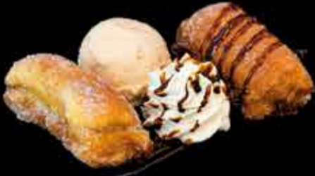
Torrijas Punt® - 5,40€ Con nata y helado de vainilla. (2,3,5,7,11,12,13,14)